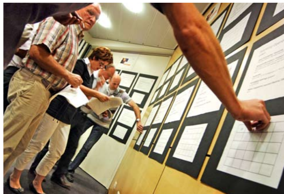
De ledenraad maakt een voorselectie door het plakken van stickertjes.